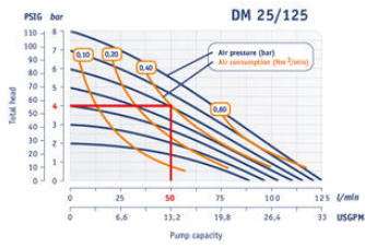
1" Pump - Performance Curve Performance based on water at 20°C