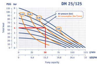
1" Pump - Performance Curve Performance based on water at 20°C