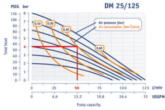
1" Pump - Performance Curve Performance based on water at 20°C