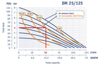
1" Pump - Performance Curve Performance based on water at 20°C